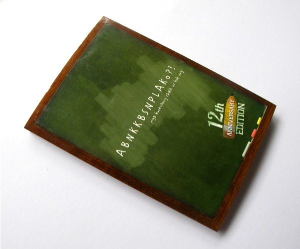
Image: Book Cover